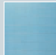
PROFILON® ALARM A1 weiß-matt mit kombiniertem Sichtschutz.